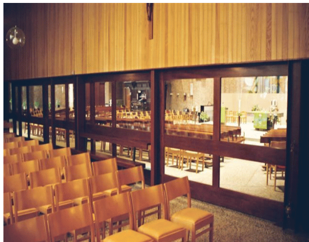
De Maria kapel na plaatsing deuren

mensen na de zondagse viering nableven, werd die ruimte erg krap. En om deze te bereiken moest men buitenom. Ook in de winter of bij slecht weer. Al deze wensen samen zorgden voor een nieuwe verbouwing. Deze begon in 2005.