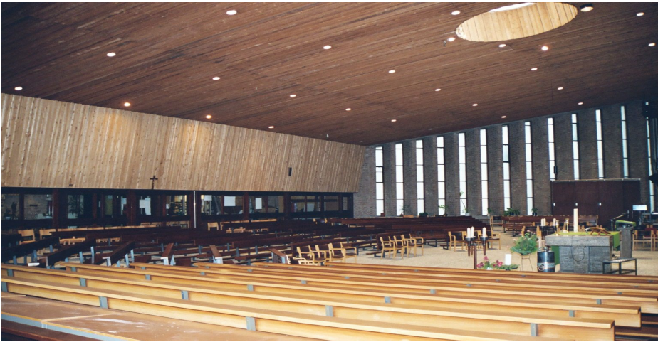
Kerkruimte na plaatsing deuren

Maar dan blijkt dat behoeftes tijdgebonden zijn. De kapel lag in de loopplichting naar de sacristie. Er was geen vergaderruimte, er waren geen toiletten. De wens voor een betere ontmoetingsruimte na de viering van vooral zondagmorgen werd ook steeds sterker. Onze kerk is vanaf de opening open en gastvrij geweest, met altijd koffiedrinken na de zondagse viering. Daar werd dan de zaal voor gebruikt, maar doordat steeds meer