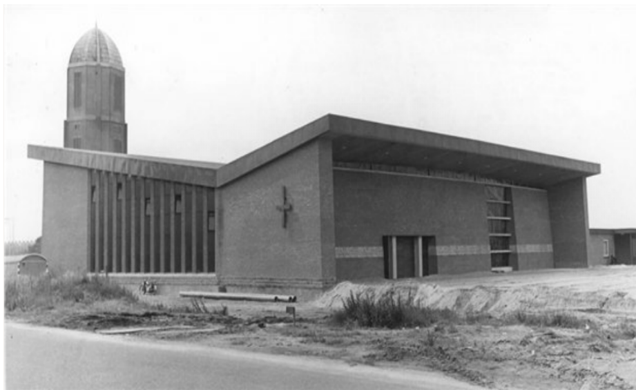
De H.Geestkerk met de watertoren