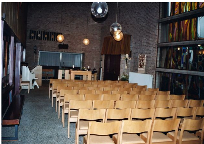
Mariakapel na plaatsing schuifdeuren

onder de knik in het dak van de kerk. En een functionele, want de wand bestond uit verschuifbare, van veel glas voorziene, deuren. Bij vieringen waarbij veel mensen aanwezig