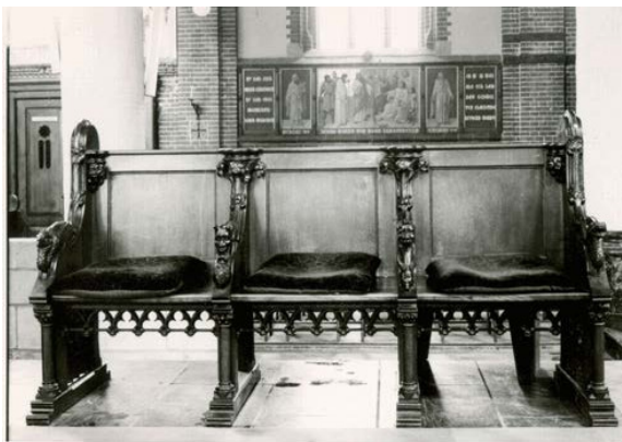
Statie in de Monica Kerk

De 14 kruiswegstaties zijn geschilderd op metalen platen. De schilder was Nicolaas Poland. Diegenen onder u die vroeger wel eens in de St. Monicakerk aan de Herenweg in Utrecht kwamen (helaas in de zeventiger jaren van de zoste eeuw afgebroken) zullen ze wel herkennen, want daar hebben ze aan de wand gehangen.