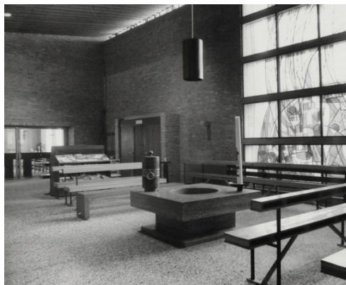
De kerk achterin met de doopvont

een kleine aanrecht, een kleine leesplank en enkele muurkasten voor de kleding. Met twee personen was de ruimte vol. De kapel werd gebruikt voor doordeweekse vieringen. Door stijgende brandstofkosten werd dit ook gedaan in de koude periode op andere minder druk bezochte dagen.