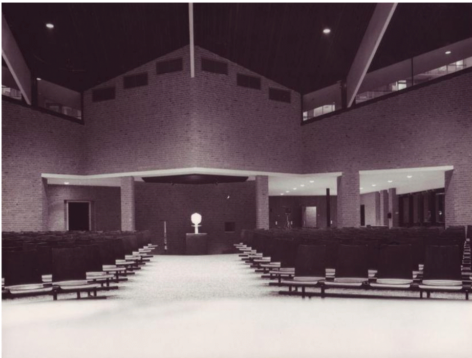
Interieur Emmaus kerk

De Emmausparochie bleef wel bestaan. Zij maakte voor haar vieringen gebruik van het Johannescentrum, waar al een goede band mee bestond. Daar ontstond ook een sterke oecumenische geloofsgemeenschap.