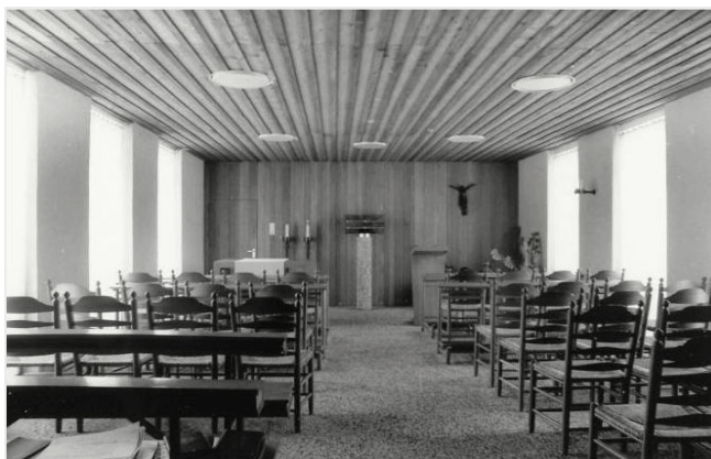
De oorspronkelijke kapel

Regelmatig bleek de kapel dan echter te klein. In die tijd werd zij ook gebruikt door Poolse gelovigen, waarvoor de ruimte in het begin groot genoeg was. Maar hun aantal nam toe. Om beide redenen ontstond het plan