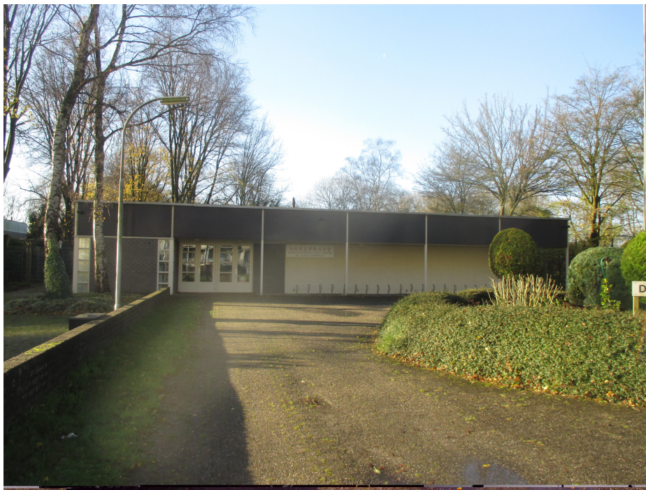
Voorkant Blijde Boodschap kerk

In augustus 1967 maakte het bisdom bekend dat Overvecht-Noord één parochie zou krijgen, in plaats van de geplande twee. Wel met drie pastores, te weten de heren M. Batenburg, J. Groensmit en Fr. Receveur. De voorbereidingen voor de bouw verliep met ups en downs, maar uiteindelijk kon architect Roebers uit Deventer op 8 mei 1970 zijn eerste bouwvergadering houden. Voordat de kerk aan de Marokkodreef op vrijdag 16 april 1971 in gebruik kon worden genomen moest er heel veel werk worden verzet. Zo werden in een "Laatste loodjes-actie" 1000 blikken erwtensoep verkocht, karweitjes voor de kerk uitgevoerd, bingo-avonden en een fietsenrally gehouden. Kortom met de inzet van vele parochianen ontstond de Blijde Boodschap kerk.