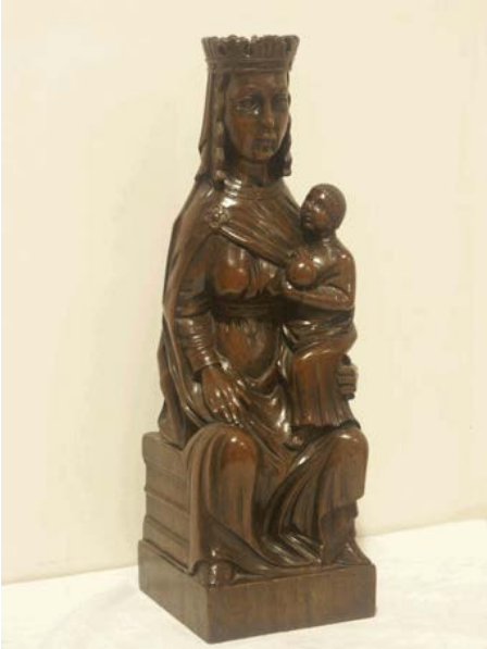
Maria, gezeten op een troon, met het Kind staande op haar schoot.

In de ontmoetingsruimte bevindt zich boven de klapdeuren naar de hal een houten voorstelling van het Laatste Avondmaal.