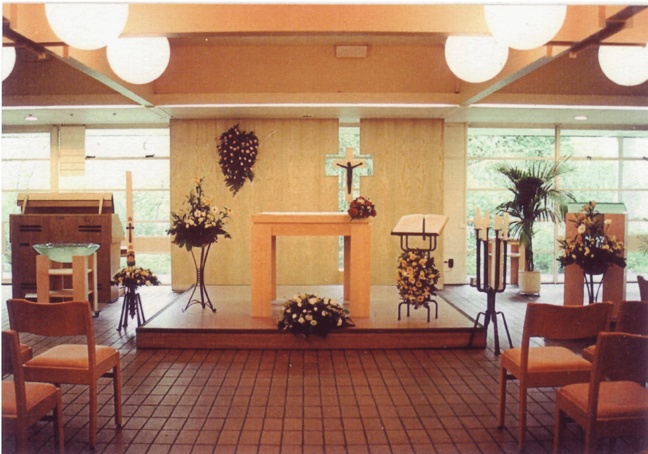
Interieur Blijde Boodschap kerk

Met een eucharistieviering op 28 december 2003 hebben de parochianen het tijdperk Blijde Boodschap afgesloten en zijn opgegaan in de nieuwe parochie voor heel Overvecht.