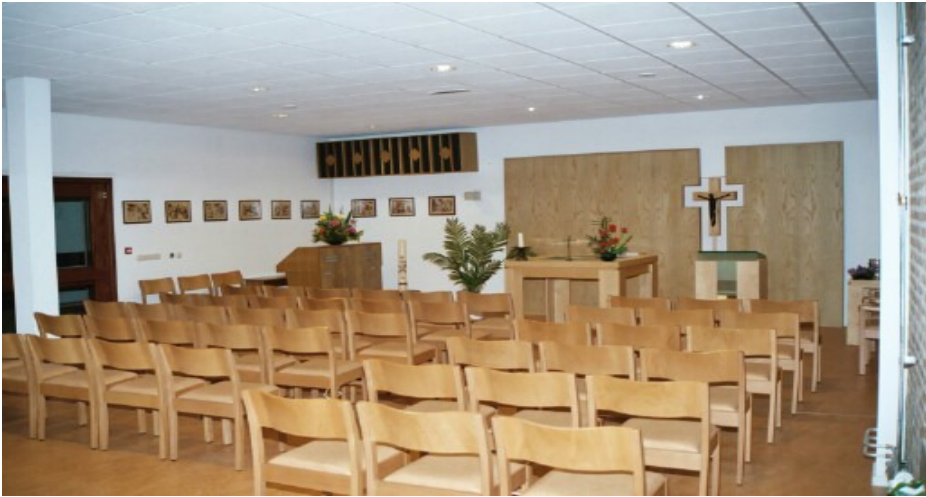
De huidige Maria kapel

Een mooie en sfeervolle kapel, ook weer Mariakapel genoemd, werd gebouwd links na binnenkomen van de kerk. Oud-parochianen van de Blijde Boodschap zullen daar heel veel herkennen uit hun kerk.